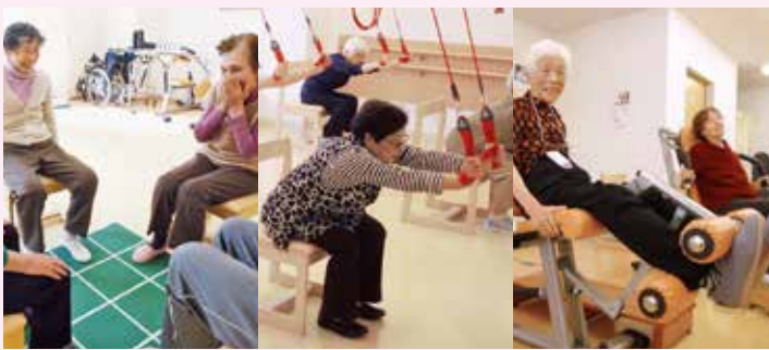
●スクエアステップ ●レッドコード運動 ●油圧マシン

随時開催 元気広場のサービスを お気軽にお電話ください。 見学・体験 できます!